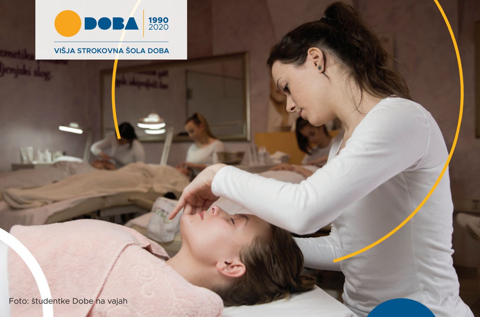
Foto: študentke Dobe na vajah